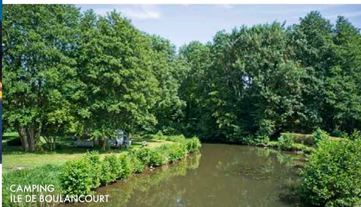
CAMPING ILE DE BOULANCOURT

Moulin de Brétigny, Bonnelles (78). lebarnhotel.com