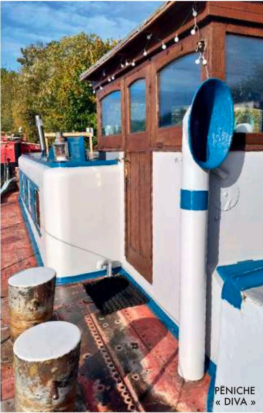
PÉNICHE « DIVA »